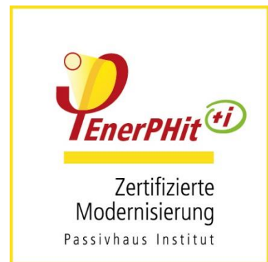
EnerPHit + -Siegel (für Gebäude mit überwiegender Innendämmung)