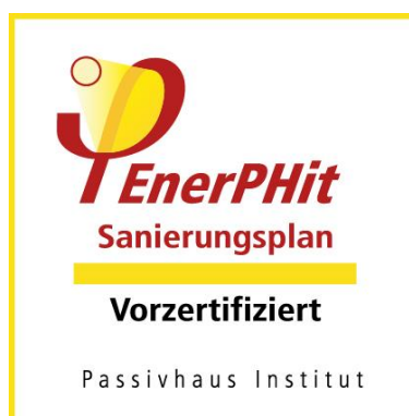
Siegel Vorzertifizierung für schrittweise durchgeführte Modernisierungen

Die Siegel dürfen ausschließlich in eindeutigem Zusammenhang mit dem zertifizierten Gebäude verwendet werden.